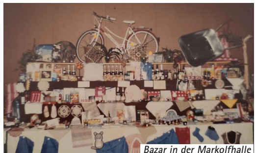
Bazar in der Markolfhalle