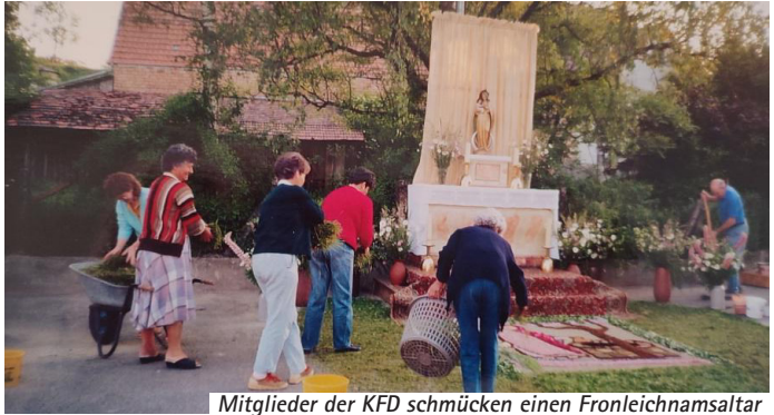
Mitglieder der KFD schmücken einen Fronleichnamsaltar