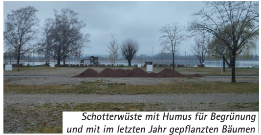
Schotterwüste mit Humus für Begrünung und mit im letzten Jahr gepflanzten Bäumen