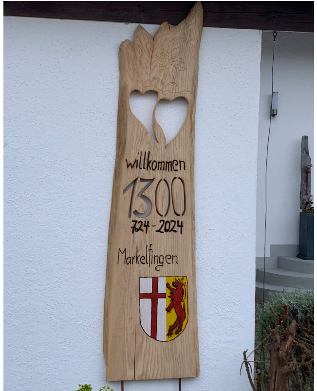
Geschnitzt von Gottfried Blum, Foto: Melanie Hafner

Unser Jungreporterteam Fasnet 2024 Auflösung der KFD RING FREI SPORT Markelfinger Köpfe Termine Das Kinderhaus „Am Römerbrunnen“ Neues aus der Villa Sonnenschein Markelfinger Hausarztpraxis Es osterbrunnt Der Campingplatz Mein Markelfingen Der historische Rundgang Der Macher Schon wieder Suchbild UPPS Pfostensprüche Adelindes Schmunzelecke LETZTER AUFRUF Danksagung Impressum